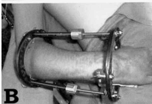
Figura 2. A) Secuela de sepsis en un paciente con afectación de miembro superior, detención del crecimiento óseo y amputaciones distales. B) Distractor de Ilizarov para alargamiento de antebrazo.

diversas opciones para cubrir los defectos creados, bien con injertos cutáneos, bien con dermis artificial (9) , que dan buenos resultados. Saber esperar y elegir el momento idóneo