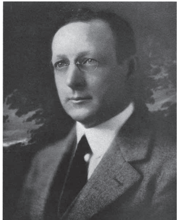
Figura 1. Walter Ellis Sistrunk.

En su vida profesional, Sistrunk se dedicó con especial énfasis a las enfermedades tiroideas, la mama y el colon. Llevó a cabo en Estados Unidos un procedimiento quirúrgico muy similar al que sus contemporáneos Charles, Konadion o Thompson describieron igualmente para tratar la elefantiasis