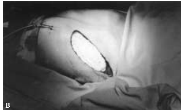
Figura 3. Injertos costales y cubrimiento con tetrafluoroetileno.

ma contralateral. Sin embargo, debido a los problemas psicológicos que acarrea la deformidad, la tendencia es a ir bajando cada día más la edad de intervención (6,8) .