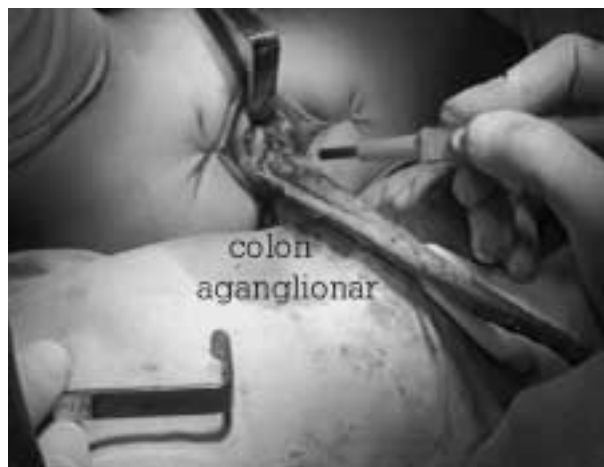
Figura 2. Resección de colon por vía perineal.

colón resecado fue de 18 cm. La intervención finalizó con una verificación laparoscópica de la cavidad abdominal.